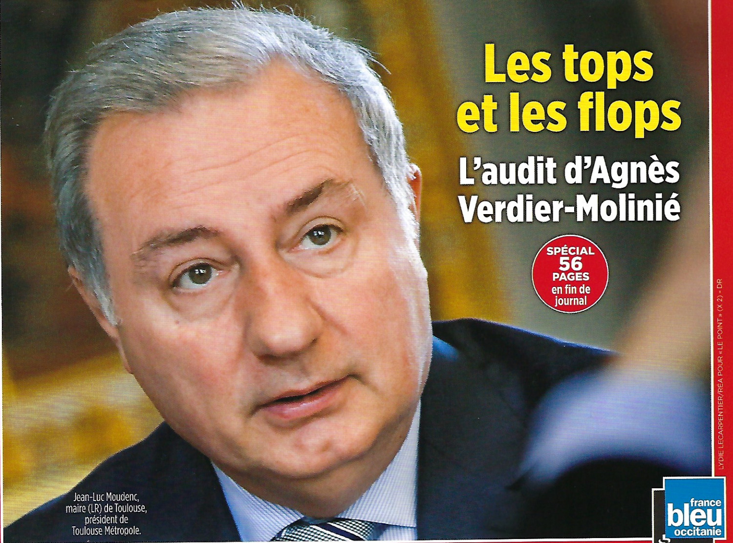
Jean-Luc Moudenc, maire (LR) de Toulouse, président de Toulouse Métropole.